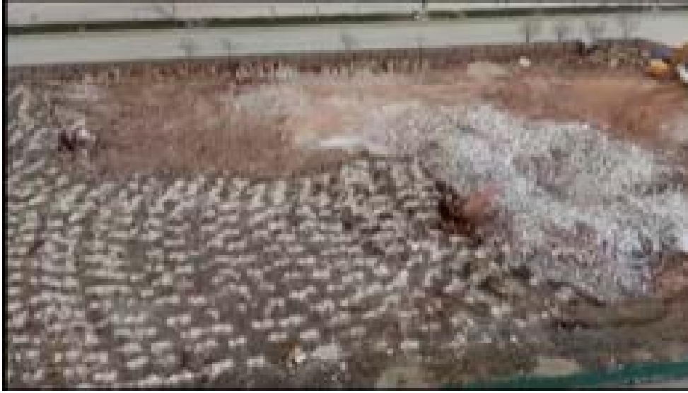
Patlatma alanı kaydı

Ayrıca bugün 20. Blok çatısından güvenliğimiz ve teknik ekibimiz tarafından patlama anı sırasında ses ölçümü yapılarak patlama video kaydı alınmıştır.